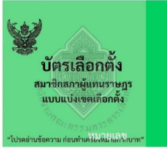
ตัวอย่างบัตรเลือกตั้ง สส. แบบแบ่งเขตเลือกตั้ง ด้านปก